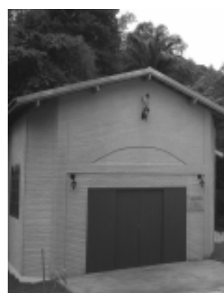
Casa do Seresteiro