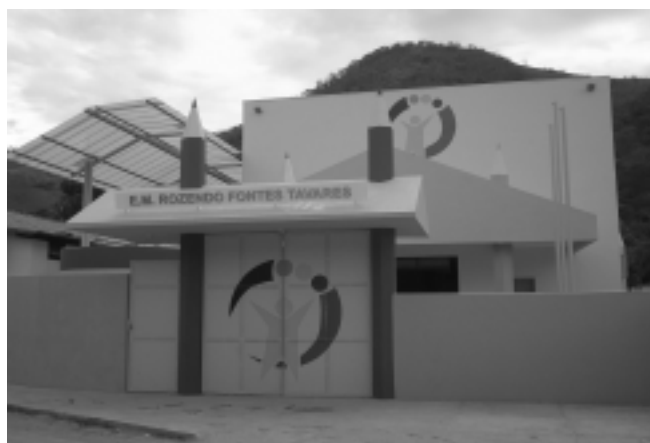
Escola M. Rozendo Fontes Tavares