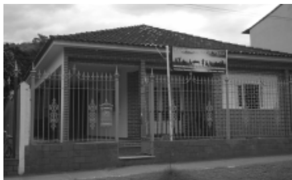
Escola M. Villa Lobos