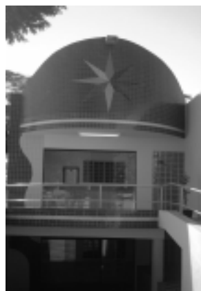
Escola M. Frei Valério